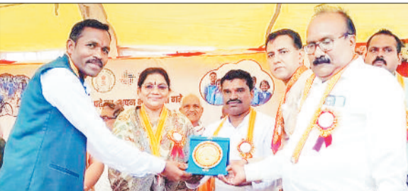
अतिथियों को स्मृति चिह्न देते अधिकारी।

बैकुंठपुर। प्रत्येक व्यक्ति के जीवन का प्रथम गुरु मां होती है, जिससे हम संस्कार की शिक्षा प्राप्त करते हैं, इसके बाद विद्यालय के शिक्षक हमारे भविष्य को गढ़ते हैं, इसलिए माता-पिता एवं अपने गुरुजन का हमेशा सम्मान करना चाहिए। उक्त विचार सोनहत जनपद अंतर्गत शासकीय उच्चतर माध्यमिक विद्यालय सुंदरपुर में