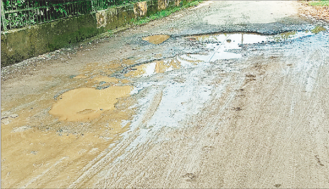
झुमका रोड के सड़क में बने जानलेवा गड़दे।

सागरपुर झुमका वोट क्लब सहित आसपास के क्षेत्रों की सड़कें अब आम जनता के लिए परेशानी ही नहीं, बल्कि जानलेवा बन चुकी हैं। लगातार बारिश और समय-समय पर मरम्मत न होने के कारण सड़कों पर जगह-जगह गहरे गड़दे बन चुके हैं। आलम यह है कि कई मार्गों पर वाहन चलाना तो दूर, पैदल चलना भी जोखिम से भरा हो गया है। ओड़गी नाका से ओड़गी-सागरपुर की ओर जाने वाला मुख्य मार्ग पूरी तरह से गड़दों से पट चुका है। बारिश में इन गड़दों में पानी भर जाने से सड़कों का अस्तित्व ही मिट जाता है और हर समय दुर्घटना की आशंका बनी रहती है। यह मार्ग ना सिर्फ आम जनता, बल्कि प्रशासनिक अफसरों के लिए भी संपर्क मार्ग है, बावजूद इसके मरम्मत नहीं की गई।