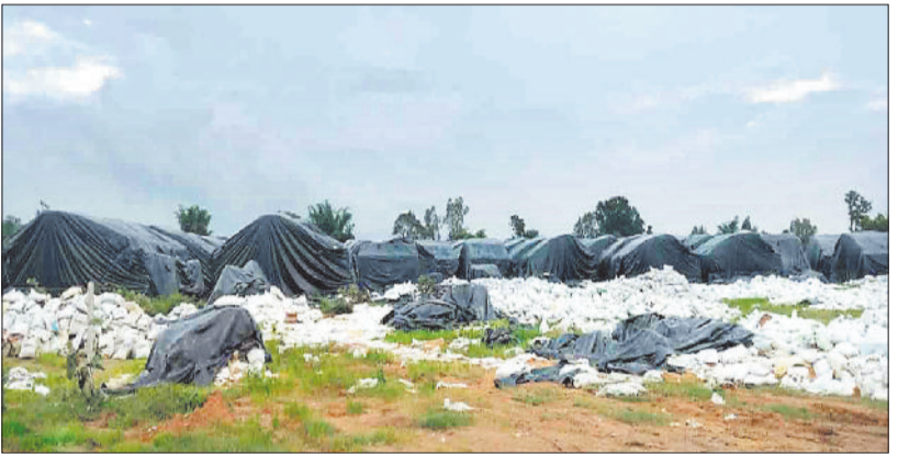
संग्रहण केंद्र में खेले आसमान के नीचे रखे धान।

गत वित्तीय वर्ष में धान खरीदी के दौरान सहकारी समितियों में बफर लिमिट से अधिक धान जमा होने एवं प्रशासनिक दबाव के बावजूद मिलरों द्वारा उठाव में रुचि नहीं होने पर विपणन संघ ने परिवहनकर्ताओं के माध्यम से जनवरी में धान का उठाव करना प्रारंभ कर दिया था। विपणन संघ जिलेभर के उपार्जन केंद्रों में जाम धान को लगातार अम्बिकापुर एवं सीतापुर स्थित खुले मैदान में बने संग्रहण केंद्र में धान का भण्डारण कराता रहा। बाद में उच्च स्तरीय चार्जे के बाद राइस मिलरों ने धान का उठाव प्रारंभ